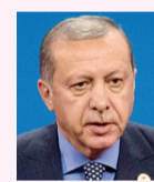
Recep Tayyip Erdogan Président de la Turquie

« On ne peut pas résoudre les difficultés nouvelles avec des méthodes anciennes. On a besoin de nouvelles idées. On a besoin d'abandonner tous les stéréotypes. Il convient de proposer à la communauté mondiale un modèle de collaboration et de développement en commun, reposant sur l'égalité et le respect de la souveraineté nationale en accord avec le droit international et les principes des Nations unies. »