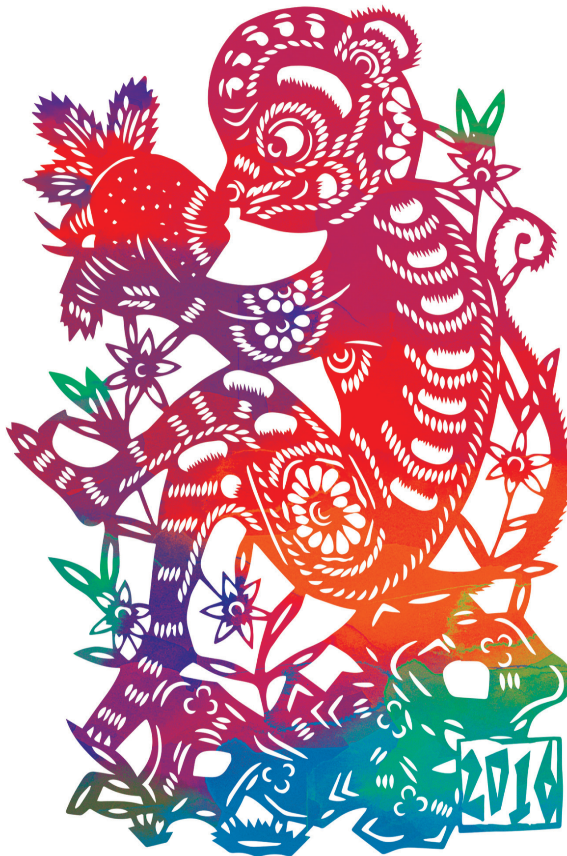
SONG CHEN / CHINA DAILY

On attribue au singe de nombreuses caractéristiques conflictuelles. D'un côté, il est synonyme d'impatience, comme en témoigne l'expression chinoise qui se traduit par « pressé comme un singe », mais d'un autre côté, l'origine de son nom, en chinois, renvoie à une forme d'intelligence qui incite à ne pas se jeter dans des situations incertaines. Jadis, quand les chasseurs utilisaient de la nourriture comme appât, les singes montaient en haut des arbres et guettaient un éventuel danger, attendant leur heure jusqu'à ce que le danger – les chasseurs en l'occurrence – soient partis pour aller chercher la nourriture. « Singe », hou en chinois, a deux paronymes qui, contrairement à ce que l'on pourrait penser, sont effectivement reliés ensemble à la racine. L'un est denghou , qui veut dire « en attente », soit la tendance atypique à résister à une gratification immédiate. L'autre paraît un peu plus tiré par les cheveux : il se réfère aux anciens vassaux qui devaient jongler avec des forces mouvantes pour maintenir leur assise du pouvoir. Il leur a fallu acquérir la faculté de s'adapter avec ruse et de réagir rapidement, faute de quoi ils perdaient leur domaine, voire leur tête. On les appelait les